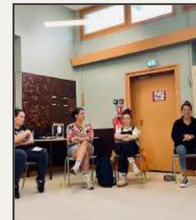
Les réflexions en équipe ou avec les habitant.es