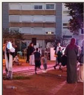
Pop Festival 2025