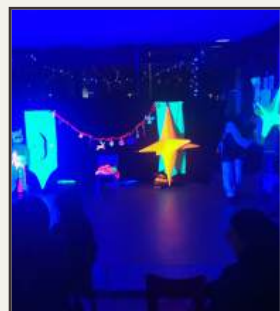
Des vacances pour petit.es et grand.es