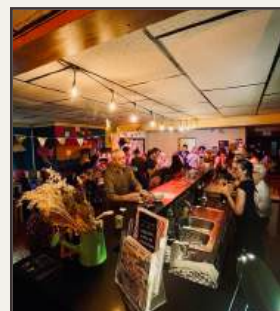
Le bar de la MJC en 2025