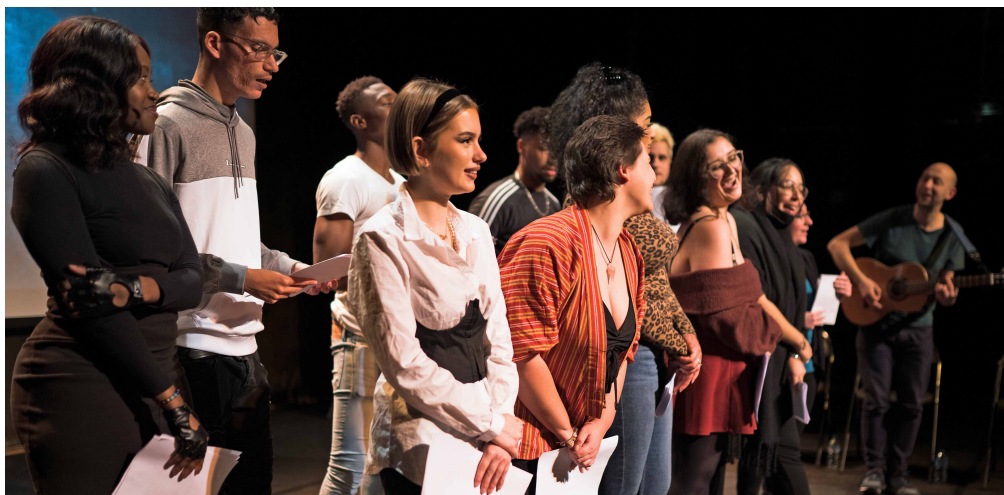
La Troupe 21-22