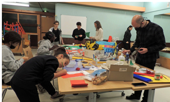
Atelier découpe avec la troupe et le secteur jeunes

Cette fête avait pour but de rassembler équipe professionnelle, bénévoles ainsi que les adhérents et leur famille, autour d'une journée festive. Cette journée débute généralement par un repas partagé, suivi d'animations dans le jardin de la MJC autour de différents jeux et stands (animés par les jeunes du secteur jeunes).