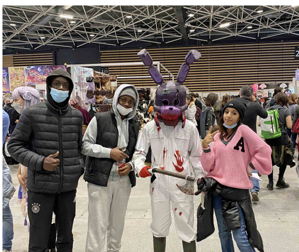
Le secteur jeunes

Les créances et les dettes ont été évaluées pour leur valeur nominale.