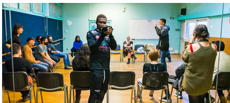
La troupe 21-22