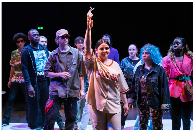
La Troupe 20-21