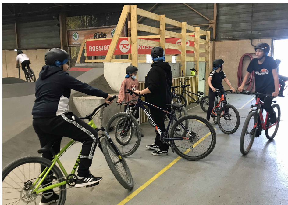
Le secteur jeunes