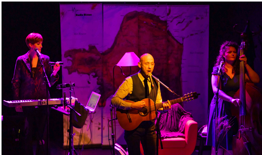
Radio Bistan

Spectacle soutenu financièrement par la DRAC Auvergne Rhône-Alpes, le CNM et la SPEDIDAM.