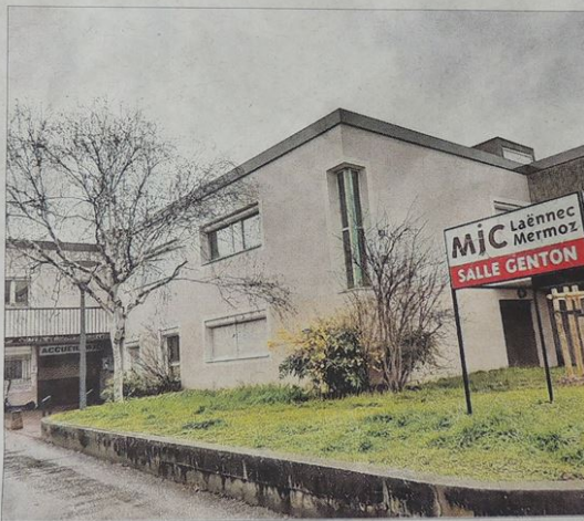
Le maire a profité d'une question sur l'avenir de la MJC Laënnec-Mermoz pour préciser « qu'il y aura besoin de rénovations ».

« Nous nous interrogeons sur l'équipement public qui devrait apparem-