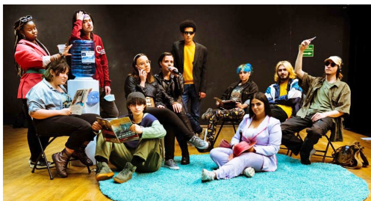
La troupe 20-21