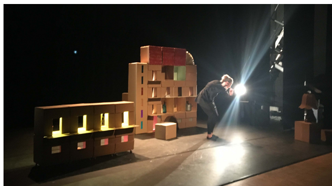
Festival Gones et Compagnies

Nous constatons que ces événements ont eu un impact significatif sur nos projets depuis mi-mars 2020.