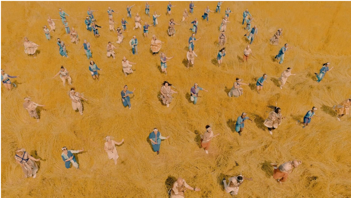
clip « Ninki Nanka » à Miribel le 06 juin 2021

Aucun jour ne s’est passé sans étudier de nouveaux scénarios. Nous n’avons pas écarté les moins optimistes. Afin de valoriser le travail effectué, nous avons écrit un état des lieux sans concession qui rendait compte des actions concrètes de l’équipe artistique et des structures partenaires à la date de suspension du projet. Il donne des explications sur la densité et la complexité de l’ingénierie du dossier Afriquarks tel que nous l’avons mené.