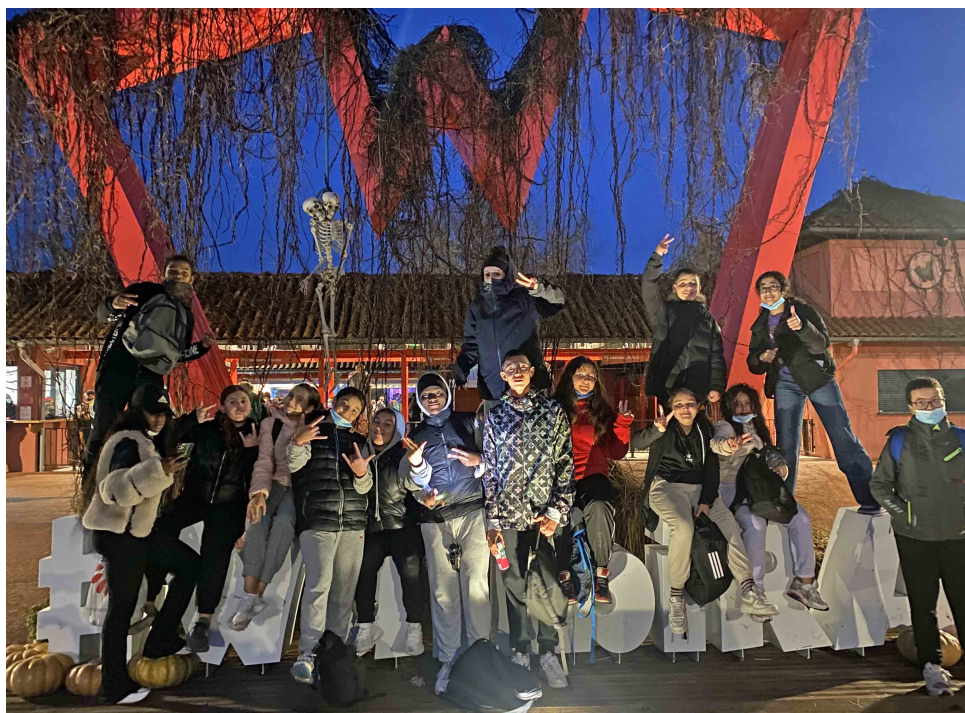
Le secteur jeunes

MJC Laënnec-Mermoz 21 rue Genton 69 008 Lyon 04 37 90 55 90 secretariat@mjclaennecmermoz.fr www.mjclaennecmermoz.fr