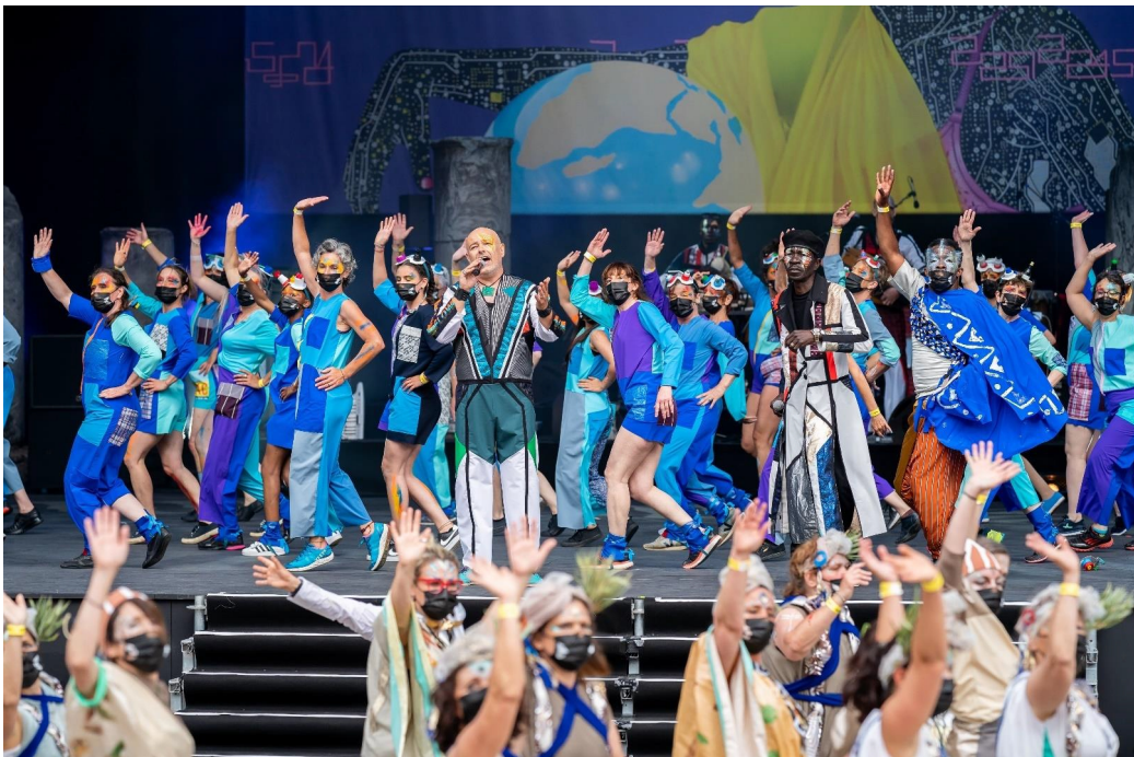
Biennale de la Danse 2021

Plus que la sensibilisation, l'émancipation par la rencontre publics/artistes mobilise toute notre attention. Sur le terrain, la relation et l'interaction éveillent souvent une envie de culture qui se manifeste par un désir spontané de participer ou d'en être.