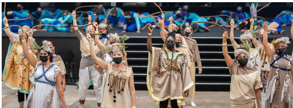
Peuple du sable

En croisant la réécriture artistique du spectacle et la faisabilité pédagogique avec les budgets restants, nous avons été contraints aux coupes franches et n'avons pu maintenir que les ateliers de danse et costumes. Nous avons de plus limité les ateliers costumes à un seul créneau (Moulin à Vent), là où initialement plusieurs antennes permettaient d'accueillir d'autres ateliers couture pour étendre le champ d'action sur le 8ème et le 3ème arrondissement.