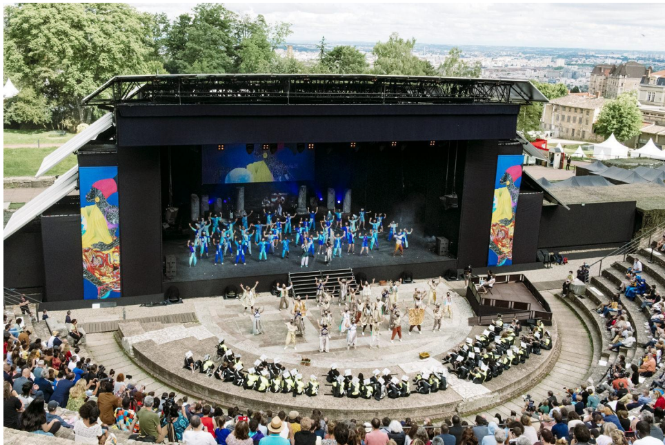
Défilé de la Biennale de la Danse

Un grand moment d'émotion et de partage. Si le chemin pour y parvenir a été parsemé d'embûches, nous retenons la ferveur des artistes et des participants et l'enthousiasme des spectateurs.