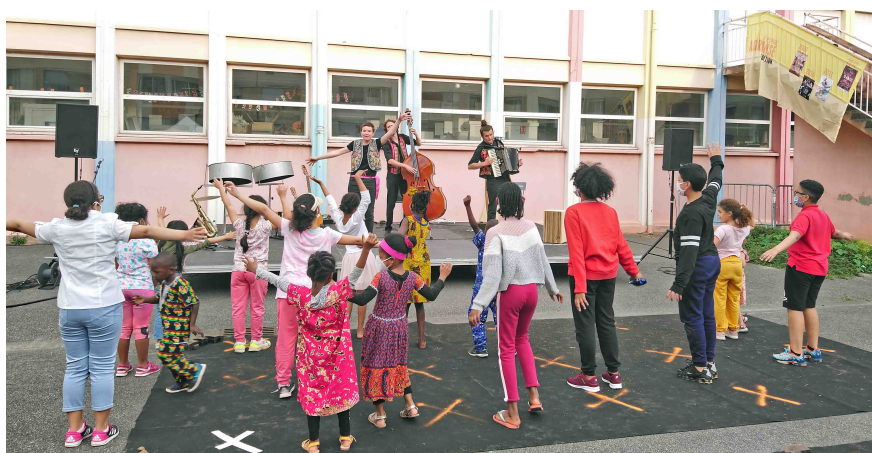
Acordanse à l'école Olympe de Gouge