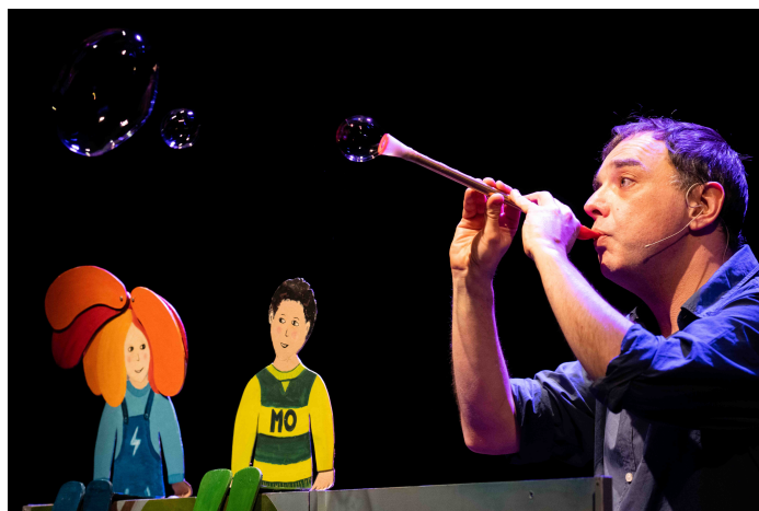
Momo sans 1 mot

En coproduction avec le Festival des Rêveurs éveillés / Service culturel de la ville de Sevrans.